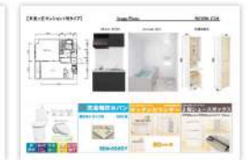
▲「プレゼンシート」作成例