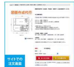
サイトでの 注文画面

※間取り図によって異なりますが、図面作成の期間は最短で3~5営業日になります。 ※混み合う時期は7営業日程かかる場合もございます。